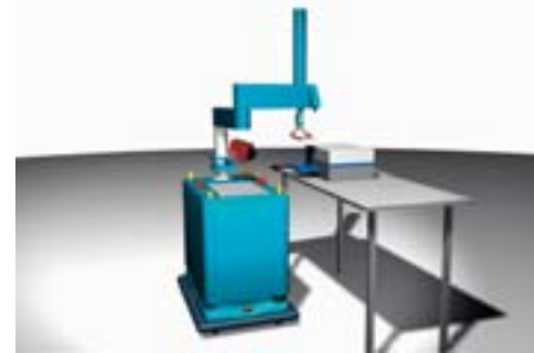
Dieser Service-Roboter entsteht im Verbundprojekt Lisa

Auch das Fraunhofer Institut für Fabrikbetrieb und -automatisierung entwickelt interaktive Assistenzroboter - und zwar für den Li-